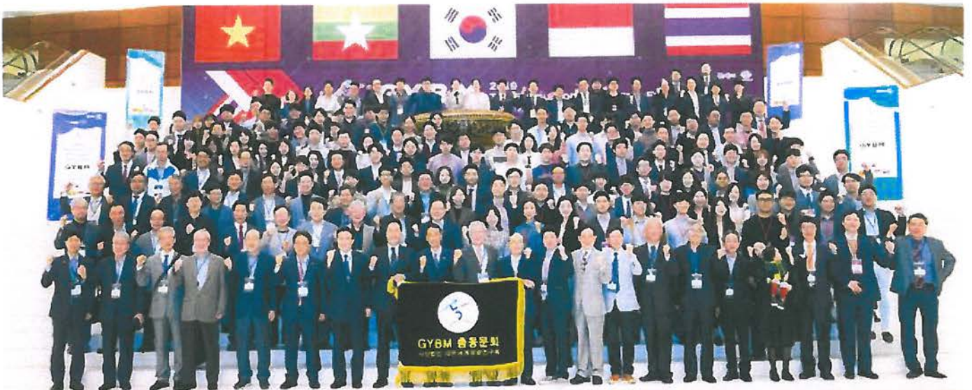
2019.12.14 GYBM 총동문회 창립대회 단체사진 (베트남 하노이 NCC)